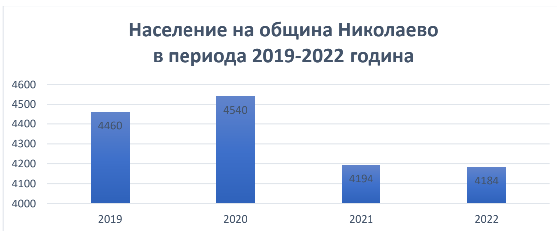
Графика 1. Население на община Николаево в периода 2019-2022 година

По официални данни на Националния Статистически Институт, населението на община Николаево през 2022 г. е възлизало на 4184 жители , като през предходните 2019, 2020 и 2021 г. е наброявало респективно 4460, 4540 и 4194 човека (графика 1).