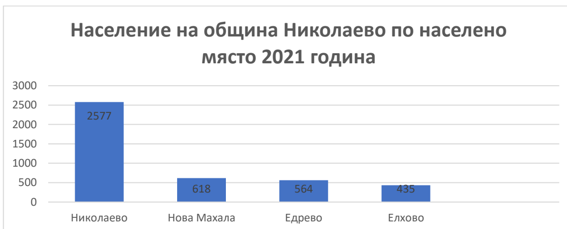
Графика 3. Население на община Николаево по населено място 2021 година

Говорейки за местоживеене, община Николаево обхваща четири населени места – гр. Николаево, с. Нова Махала, с. Едрево и с. Елхово. Административният център на общината е град Николаево, който през 2021 г. по данни на Официалния сайт на Община Николаево е с население 2577 жители; в с. Нова Махала, с. Едрево и с. Елхово живеят респективно 618, 564 и 435 жители (графика 3).