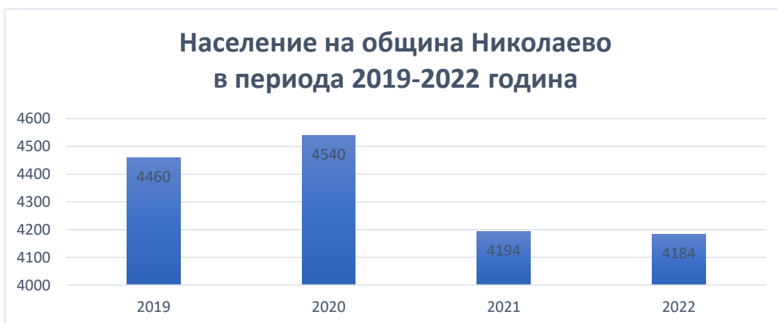
Графика 1. Население на община Николаево в периода 2019-2022 година

По официални данни на Националния Статистически Институт, населението на община Николаево през 2022 г. е възлизало на 4184 жители , като през предходните 2019, 2020 и 2021 г. е наброявало респективно 4460, 4540 и 4194 човека (графика 1).