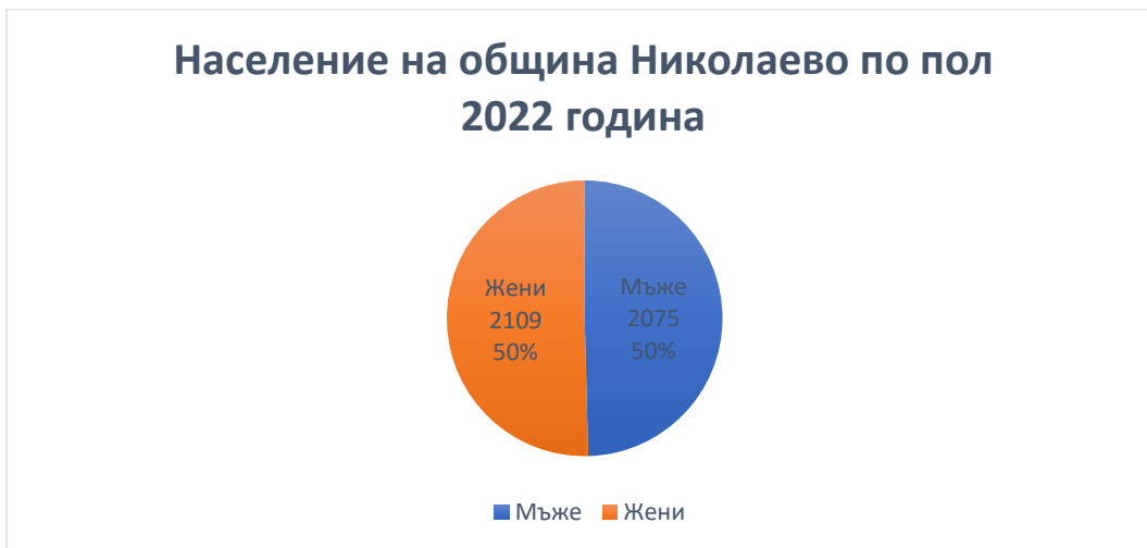
Графика 2. Население на община Николаево по пол 2022 година

Николаево по пол е както следва: 2075 мъже и 2109 жени или приблизително 50/50 (графика 2).